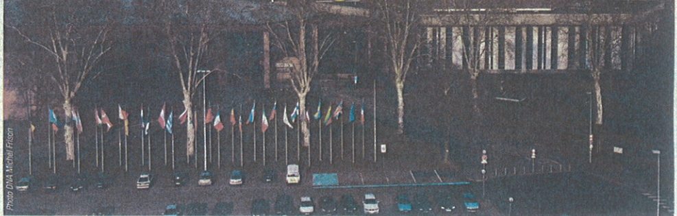
Le Palais des congrès a fait le plein en 2009. Sa modernisation et son extension s'avèrent urgents.